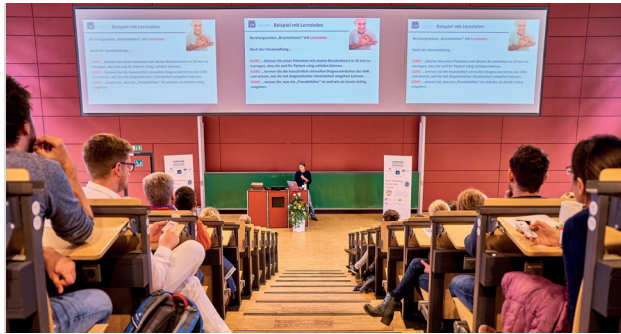
Interaktive KeyNote-Veranstaltung auf dem TdW

Mi, 21.9.2022 21. Tag der Weiterbildung im UKE 9 - 17 Uhr UKE