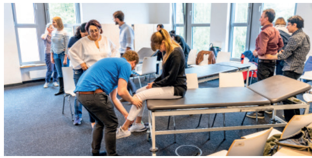
Untersuchungskurs auf dem Tag der Weiterbildung

+ Beratung zu Unterrichtskonzepten nach Bedarf