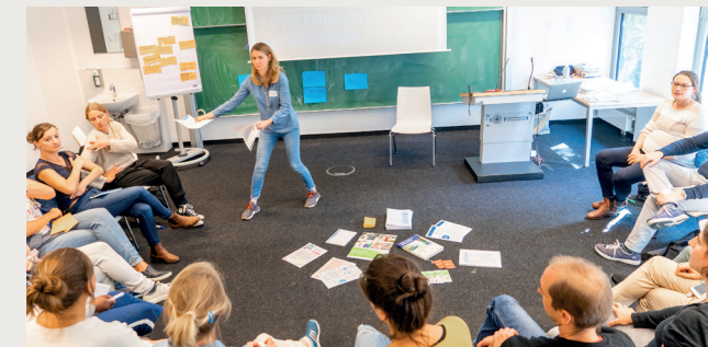
Einblick in eine Mentoringgruppe.

Alle Themen legt die Gruppe selbst fest. Häufig sind Themen wie „Gestaltung der eigenen Weiterbildung“, „Fortbildungen und Kurse: Was macht für mich Sinn?“, „Work-Life-Balance/Vereinbarkeit von Familie und Beruf“ oder „Vorbereitung auf die Facharztprüfung“.