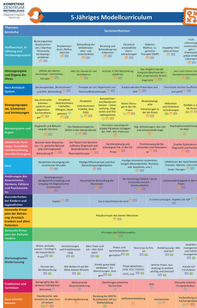
Matrixschema des 5jährigen Curriculums: www.uke.de/kwvh

Thematische Kategorien des Seminarprogramms