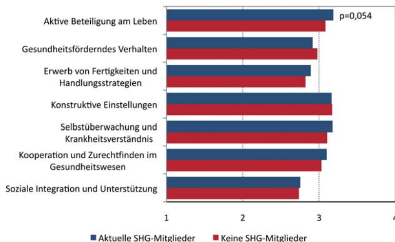
Abb. 1: Unterschiede in der Gesundheitskompetenz zwischen Selbsthilfegruppenmitgliedern und Nicht-Mitgliedern (Skala von 1 bis 4; 4 = „Bestwert“). p = Signifikanz (ab einem Wert von kleiner als 0,05 oder 5 Prozent spricht man von „statistischer Signifikanz“).

Neben den Angaben zu Alter, Bildung, Geschlecht und Familienstand wurden Tinnitus-spezifisches Wissen, Behandlungsoptionen, medizinische Leitlinien, sozialrechtliche Regelungen, Patientenrechte, die Handlungskompetenz in Arztgesprächen, Inanspruchnahme von Beratungen und Informationen zur Erkrankung sowie Fragen zur Gesundheitskompetenz und zum Umgang mit der Erkrankung erfasst. Die Ergebnisse der Mitglieder von Selbsthilfegruppen wurden verglichen mit den Ergebnissen der Betroffenen, die noch nie eine Selbsthilfegruppe besucht haben. Hierbei wurden Alter, Geschlecht, Schulbildung etc. immer berücksichtigt („statistisch kontrolliert“), um auszu-