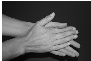
Schritt 1: Reiben Sie Handfläche auf Handfläche, ggf. die Handgelenke.