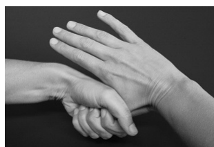
Schritt 5: Kreisendes Rei-ben des rechten Daumens in der geschlossenen lin-ken Handfläche und umge-kehrt