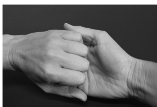
Schritt 4: Gehen Sie mit der Außenseite der ver-schränkten Finger auf die gegenüberliegenden Handflächen.