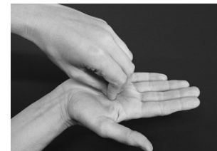
Schritt 6: Kreisendes Rei-ben mit geschlossenen Fingerkuppen der rechte Hand in der linken Hand-fläche und umgekehrt.