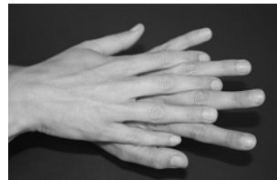
Schritt 2: Reiben Sie die rechte Handfläche über lin-ken Handrücken und um-gekehrt.