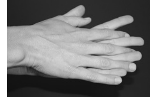
Schritt 3: Handfläche auf Handfläche mit ver-schränkten, gespreizten Fingern.