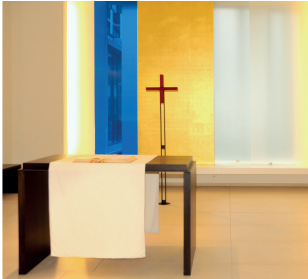
Raum der Stille im Hauptgebäude (O10) im 2. OG