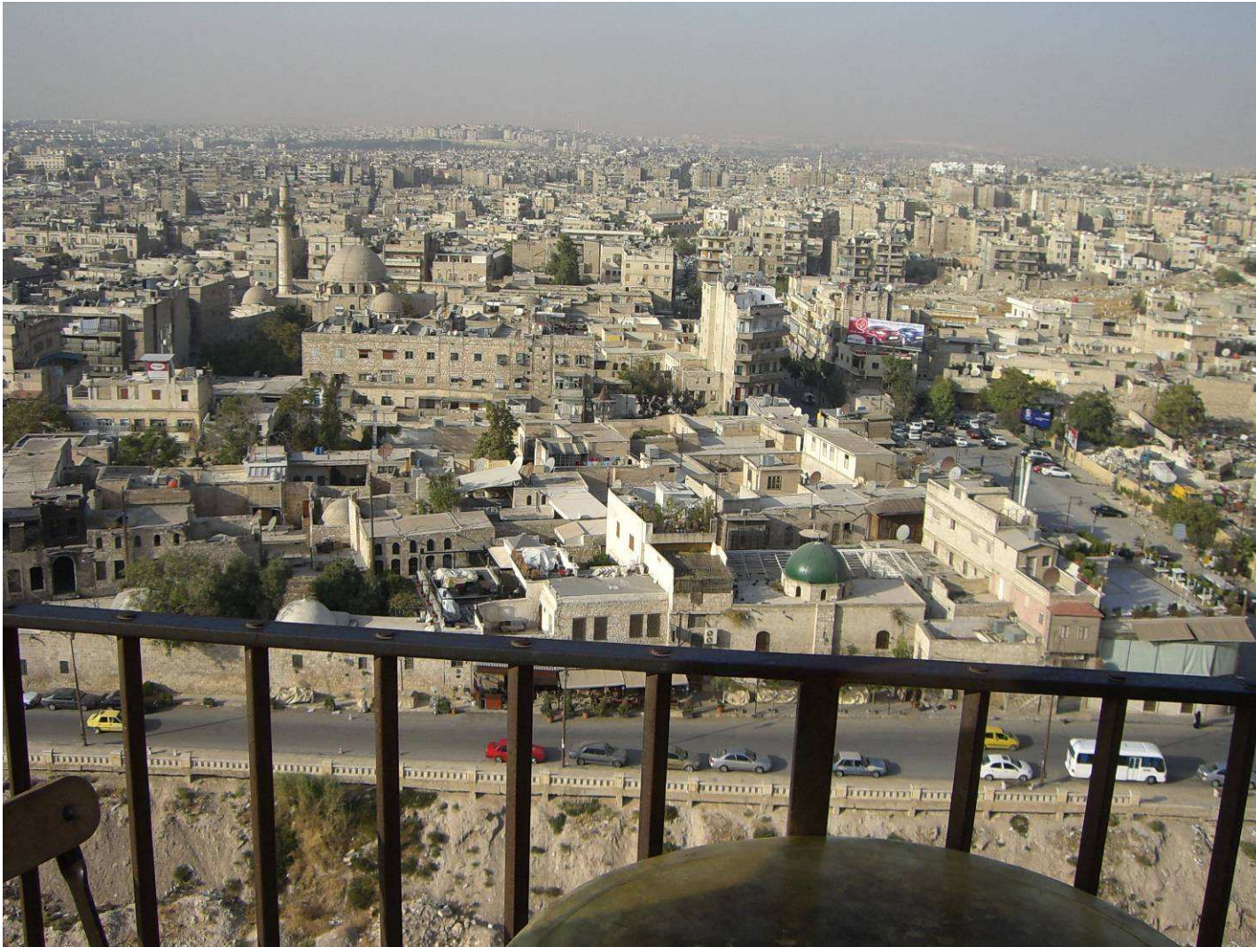
Blick auf Aleppo von der Zitadelle