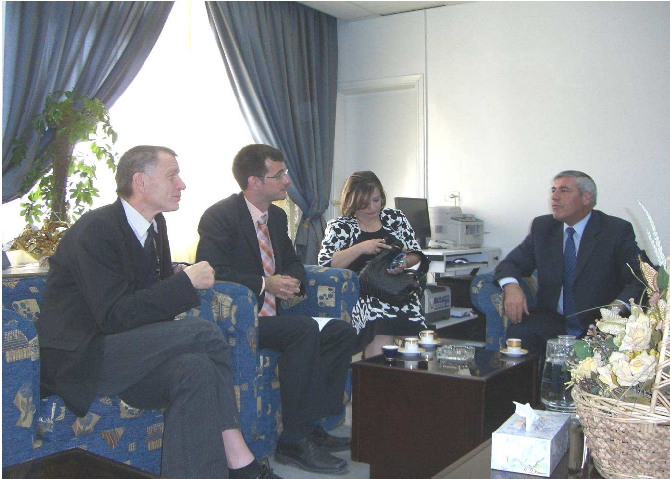
Gespräch beim Dekan der pädagogischen Fakultät der Universität Damaskus