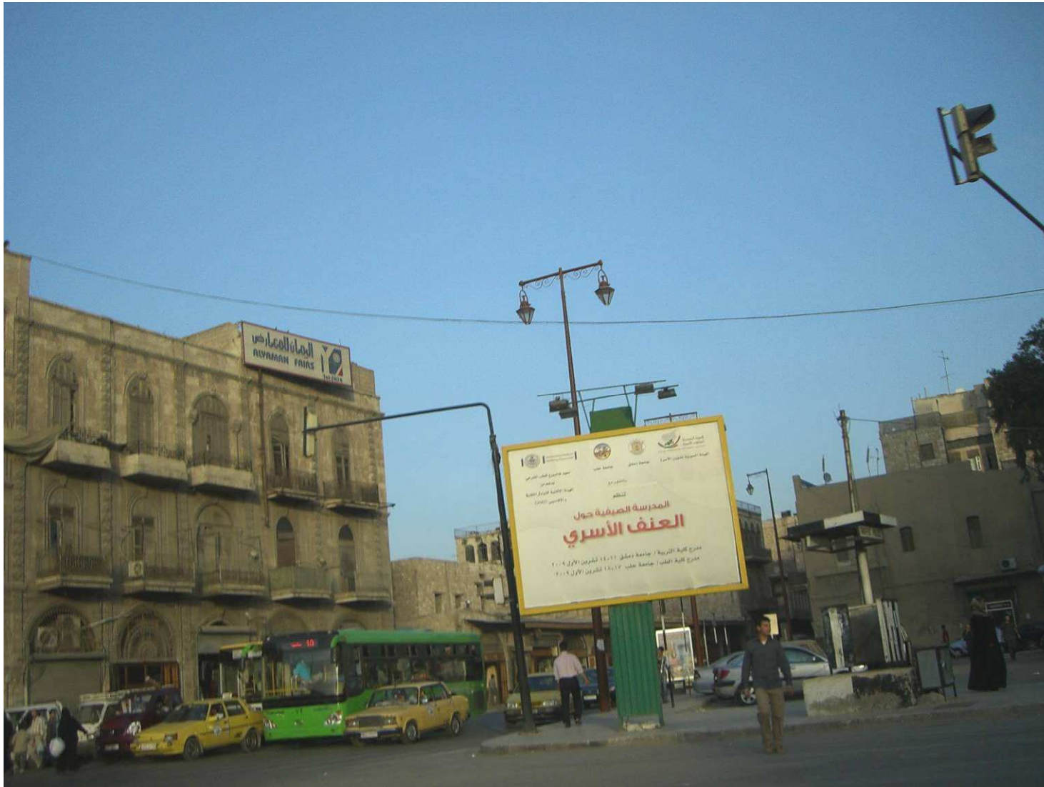
Hinweisschild auf die Summer School auf belebter Straße in Aleppo