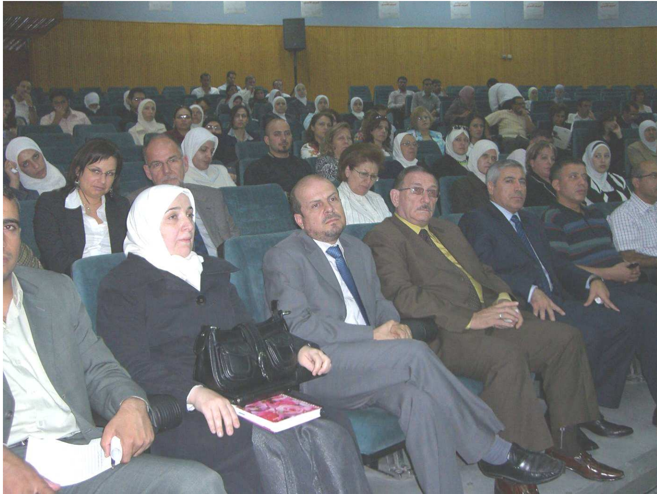
Das Auditorium in der Universität Damaskus, Hörsaal der pädagogischen Fakultät