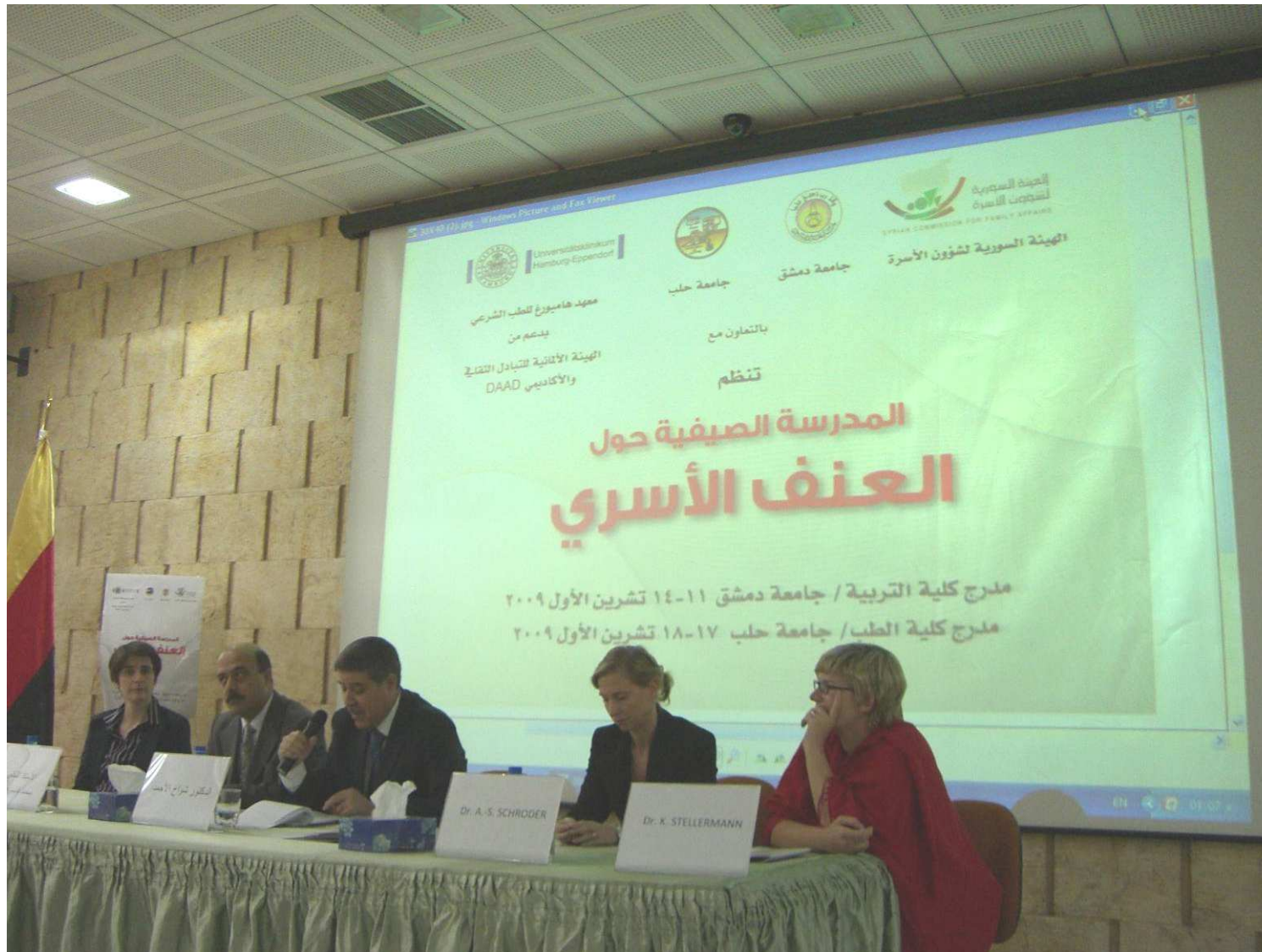
Abschlussdiskussion in Aleppo