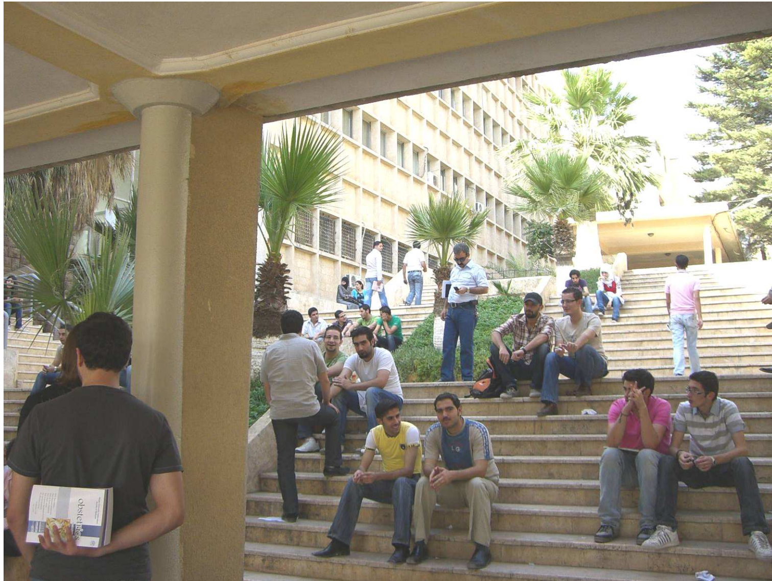
Studierende an der Universität Aleppo während einer Pause