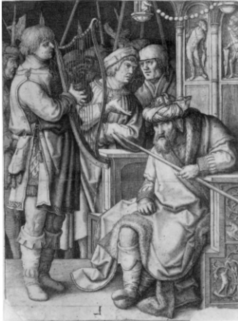
Lucas van Leyden: David spielt vor Saul, Kupferstich, um 1508.

Die tragisch im Suizid endende biblische Geschichte des ersten israelitischen Königs Saul erzählt von "Behandlungen", wie dem Harfenspiel, mit dem der junge David den aufbrausenden und bedrückten Saul zu besänftigen suchte.