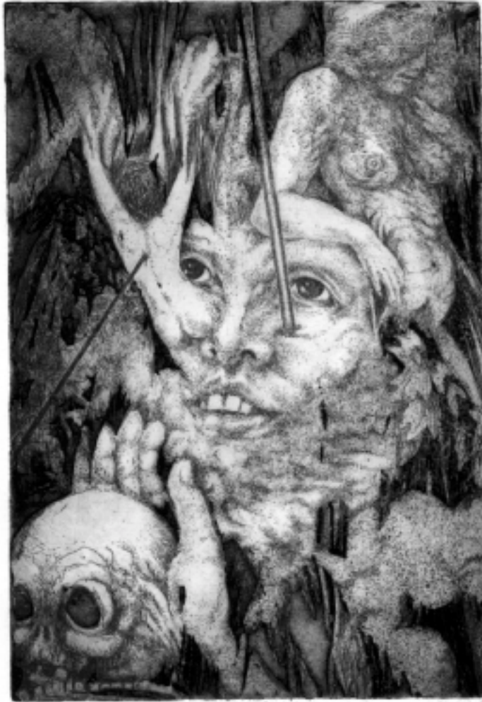
Bettina Hübner: Suicidal, Radierung, ohne Jahr.